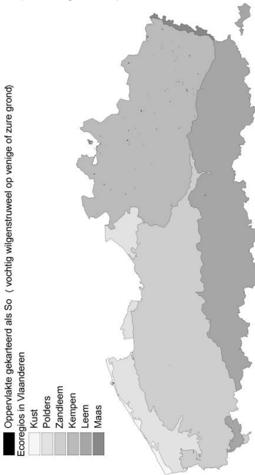
Fig. 2 Verspreiding van de BWK-eenheid So in Vlaanderen op basis van de integratie van de BWK versie 2 in de BWK versie 1.